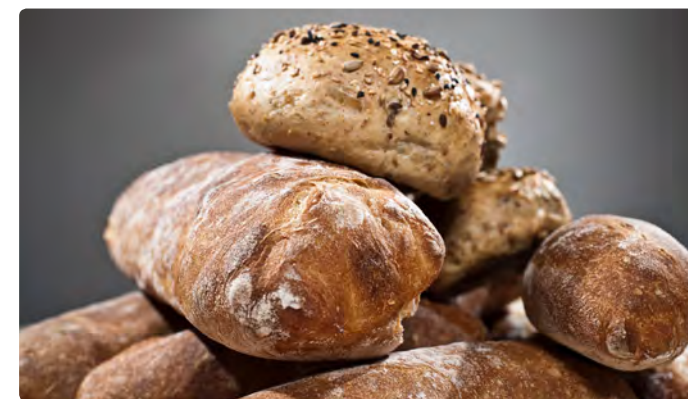
6. Rotosole делает какой-либо ремесленный хлеб идеальным. Это увеличивает выход продукции, в то время как происходит экономия - энергии, манипулирования, утилизации и персонала. И приводит к улучшению общей стоимости собственности.