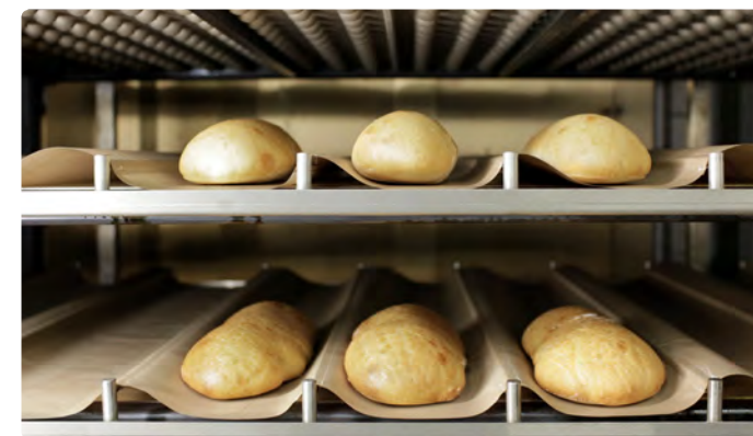
4. Rotosole устройство приподнимается - в результате чего хлеб находится в контакте с его горячей алюминиевой поверхностью.