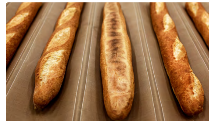
5. Таким образом ремесленный хлеб возвращается из печи такой же идеальный как и багеты, чиабаты, рогалики или что-либо, что вы туда положили.