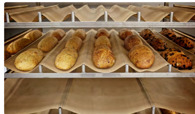
2. Вы можете загрузить Rotosole с разными противнями в соответствии с вашими потребностями.