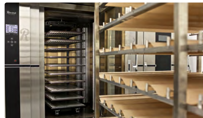
3. Установка Rotosole размещается и предварительно нагревается в печи. Все, что Вам необходимо сделать - это разместить тележки Rotosole с мягкими противнями и закрыть дверь.