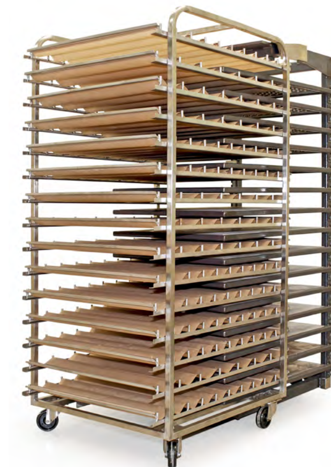
1. С Revent Rotosole, вы просто конвертируете ротационную печь в подовую печь с качественными преимуществами выпечки на горячем поде.